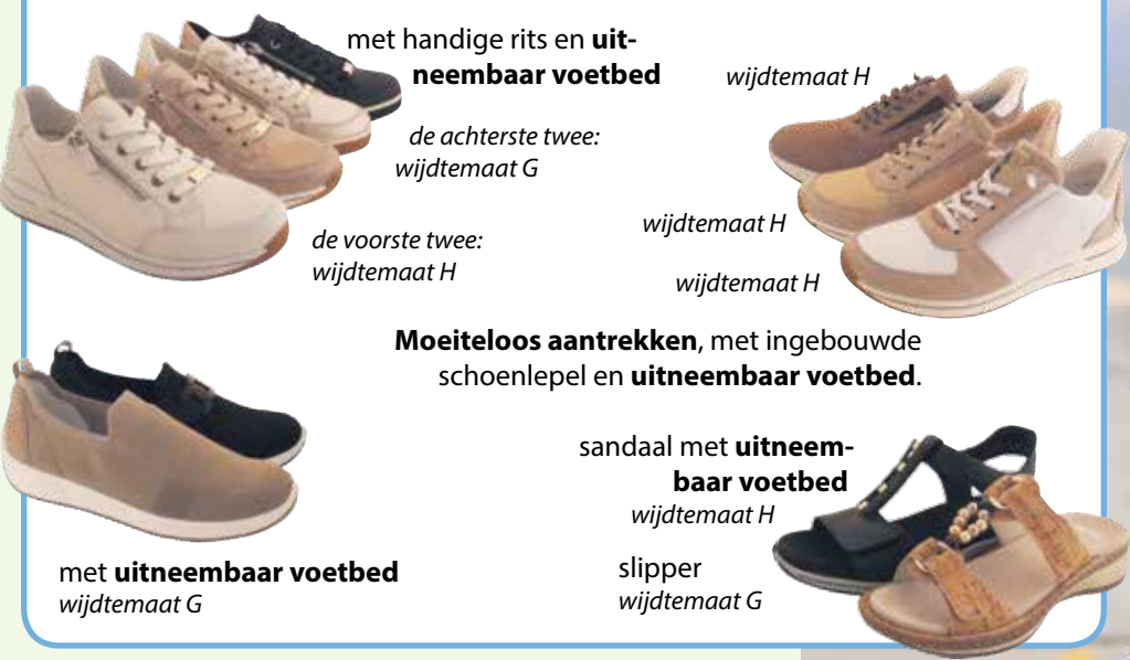
met handige rits en uitneembaar voetbed

De Duitse damesschoenen van Ara volgen de laatste mode en zijn verkrijgbaar op diverse leesten, waardoor ze voor veel voetvormen geschikt zijn. Ze zijn licht van gewicht, gemaakt van mooie, hoogwaardige materialen en hebben vaak een uitneembaar voetbed voor extra comfort. Ara biedt dit alles in een populaire prijsklasse met een uitstekende prijs/kwaliteit-verhouding.