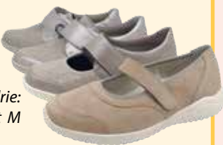
voorste drie: wijdtemaat M