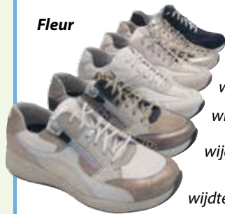
wijdte maat G wijdte maat H wijdte maat E, H wijdte maat K wijdte maat K wijdte maat G

Fleur is een stevige iets meer verende zool en de schoenen zijn vaak met Drymax gevoerd, waardoor de schoen zachter en lichter van gewicht is.