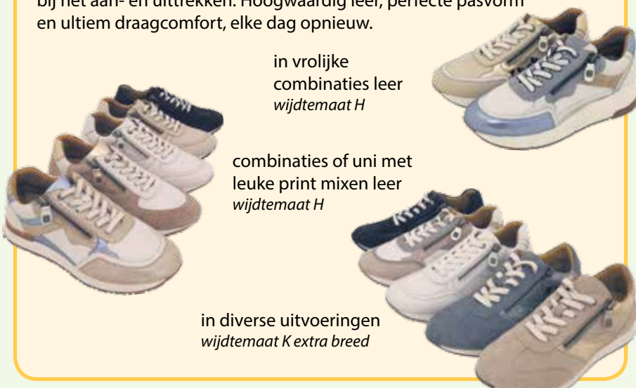
in vrolijke combinaties leer wijdte maat H

Stijlvolle Helioform sneakers in verschillende breedtematen. Voorzien van een uitneembaar voetbed , dus ook geschikt voor eigen inlegzolen. De rits aan de zijkant zorgt voor extra gemak bij het aan- en uittrekken. Hoogwaardig leer, perfecte pasvorm en ultiem draagcomfort, elke dag opnieuw.