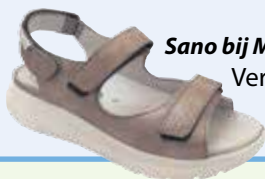
Sano bij Mephisto Verstelbaar en extra afwikkeling bij de zool