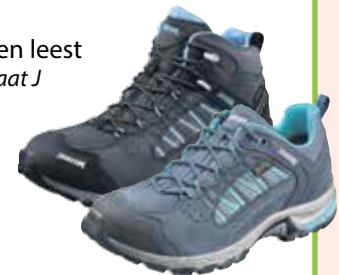
gebroken leest wijdte maat J