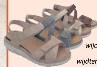
wijdte maat G wijdte maat K wijdte maat H wijdte maat E