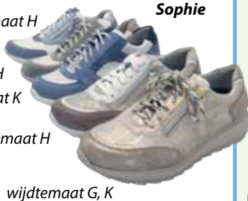
wijdte maat H wijdte maat K