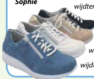
wijdte maat G, K wijdte maat K wijdte maat K wijdte maat G