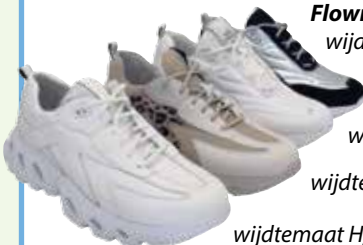
wijdte maat G wijdte maat M wijdte maat H, K

De Teddy zool (Flowmotion) is een lichtgewicht zool met extra afwikkeling, lopen kost minder energie. Ze zijn met Dry Max gevoerd, hebben een extra comfortabel voetbed voor het ultieme loopcomfort. Leren binnenzool zorgt voor optimale ondersteuning.