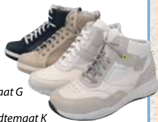
wijdte maat K plus