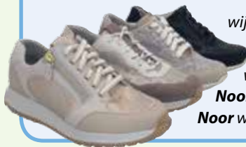
wijdte maat H wijdte maat K wijdte maat M wijdte maat H

Noor zool heeft een gestabiliseerd roll systeem, dit is een stabiele vloeiende afwikkeling met een gelijke drukverdeling. De achterste twee modellen: zool met verstijfde afwikkeling