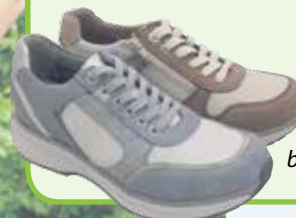
beide: wijdtemaat G