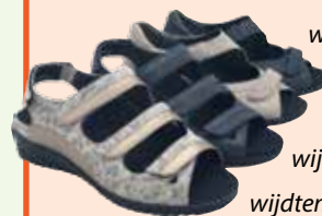
beide: wijdte maat M met stretch bij de knok