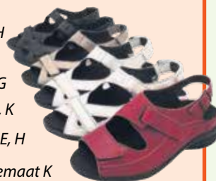
wijdte maat K wijdte maat G wijdte maat K wijdte maat H